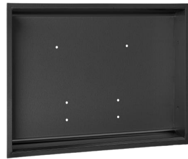
KT0016HCSB Finitura nero opaco